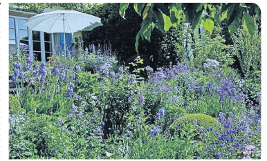
Private Gartenparadiese sind für Besucher geöffnet.

So, 23.5., 17 und 19 Uhr Grossmünster, Eingang Zwingliplatz Ticketreservation und weitere Informationen zum Programm telefonisch unter 079 333 75 16 und auf: www.bach-am-sonntag.ch