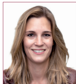
Corina Gredig Nationalrätin glp