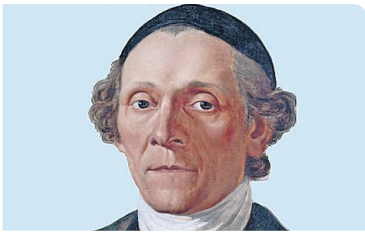
Prägender Gelehrter in Zürich: Johann Caspar Lavater.