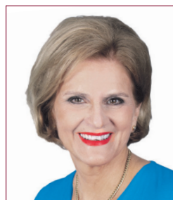
Doris Fiala Nationalrätin FDP