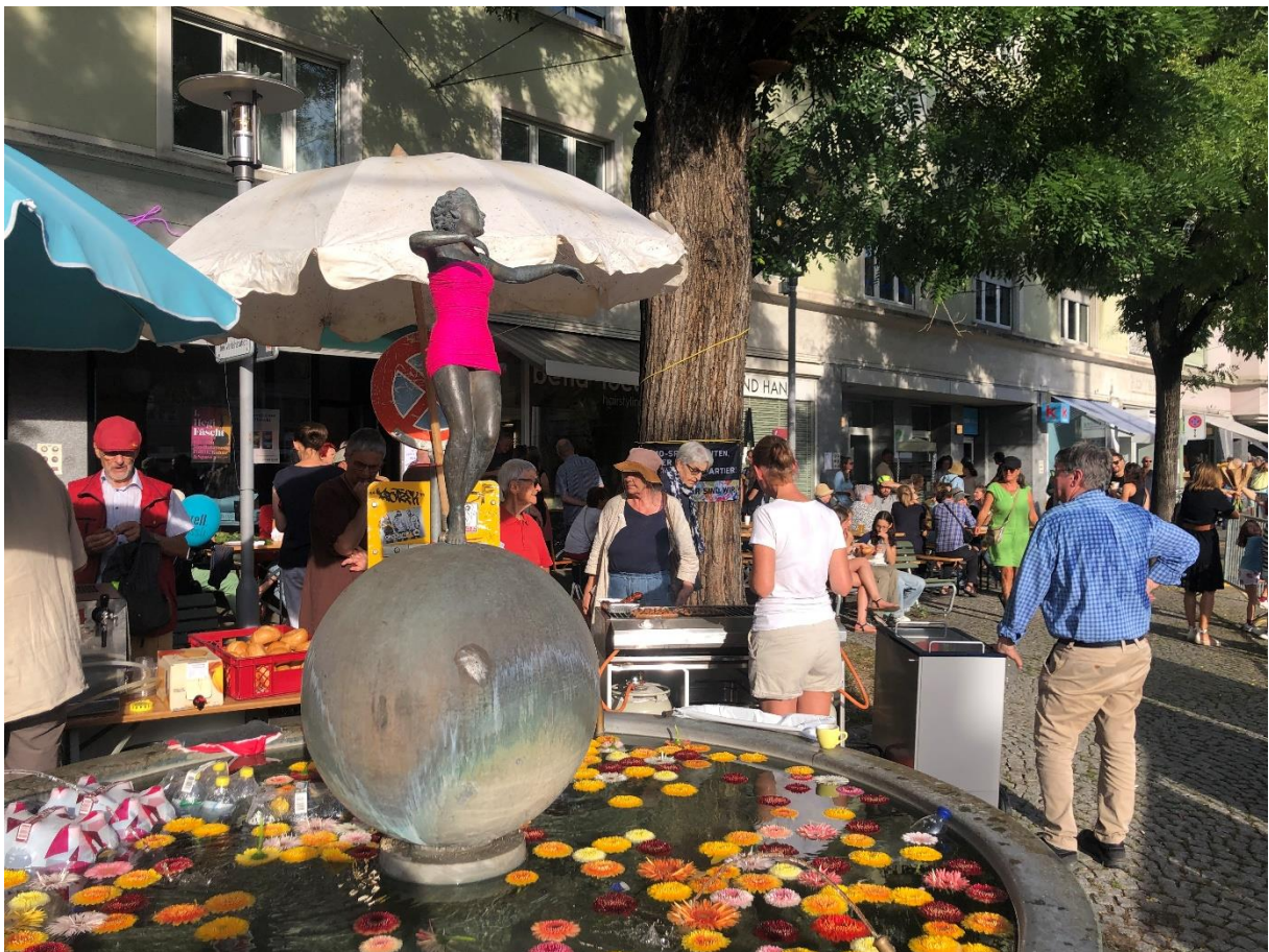
Impression vom 1. HegiFäscht

Der Quartierverein Hirslanden – gemeinsam für ein lebendiges und lebenswertes Quartier.