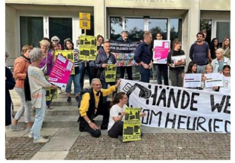
Petitionsübergabe der IG Wollishofen und Sympathisanten der

Der Stadtrat soll sich noch stärker bei Profitmaximierungs-Projekten auf die Seiten der verdrängten Mieter stellen und bezahlbaren Wohnraum fördern – unter anderem das fordern die rund 4500 Unterschriften der Petition, die von der IG Wollishofen letzte Woche an den Stadtrat übergeben wurde. Supportet wurden sie dabei von anderen Mieter-Gruppen wie «Nicht im Heuried» und «Mieten-Marta». SAG