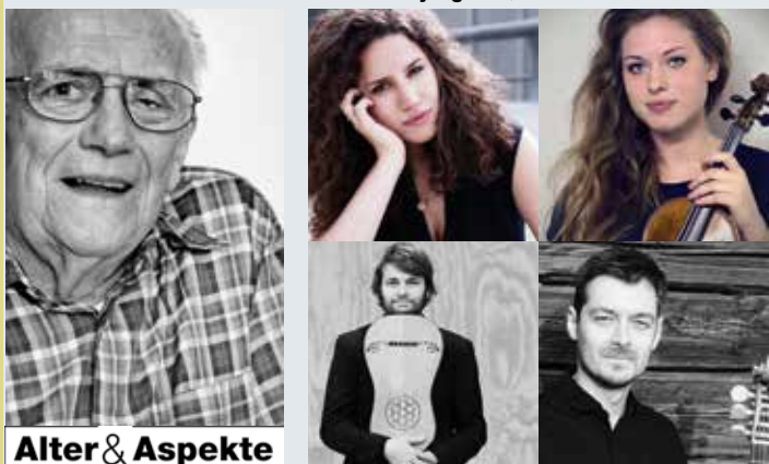
Alter & Aspekte